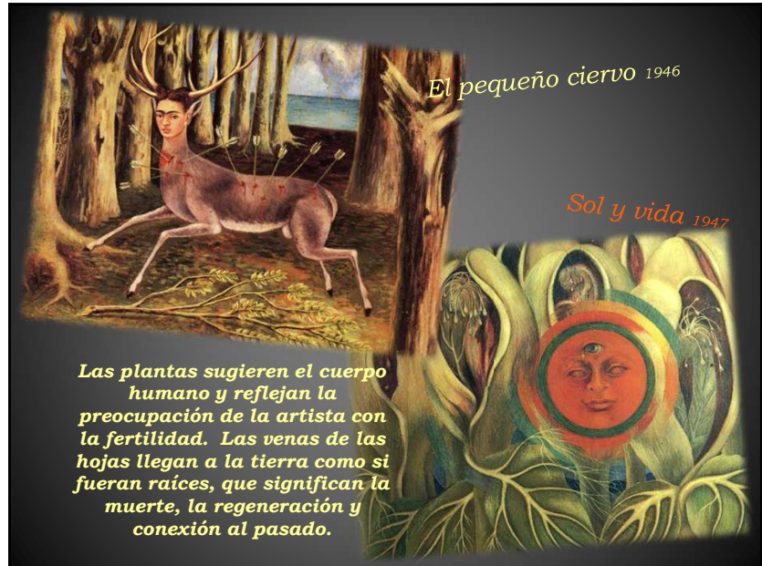
El pequeño ciervo 1946