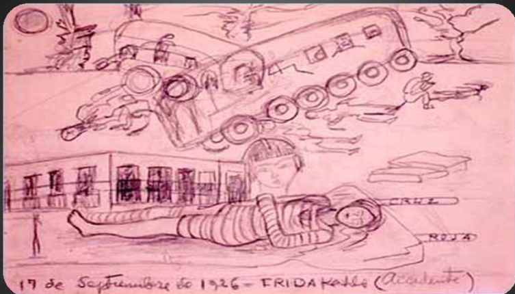
17 de Septiembre de 1926 - FRIDA Kahlo (Accidente)