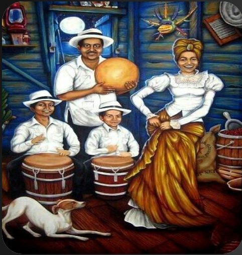
Música jíbara - Trova