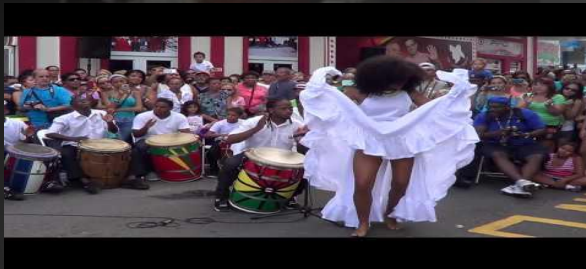
Bomba y plena