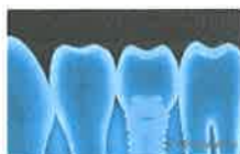
Aquí está lo que los nuevos implantes dentales deben costar