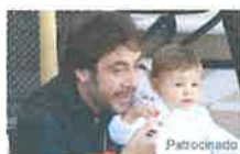
La hija de Javier Bardem era una linda niña, pero su aspecto...