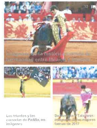
Los triunfos y las comadas de Paiklla, en imágenes