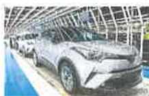
Toyota Kaizen, el secreto del más alto nivel de calidad