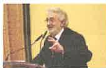
Plácido Domingo: «La Generación del 27 reconoció la ...